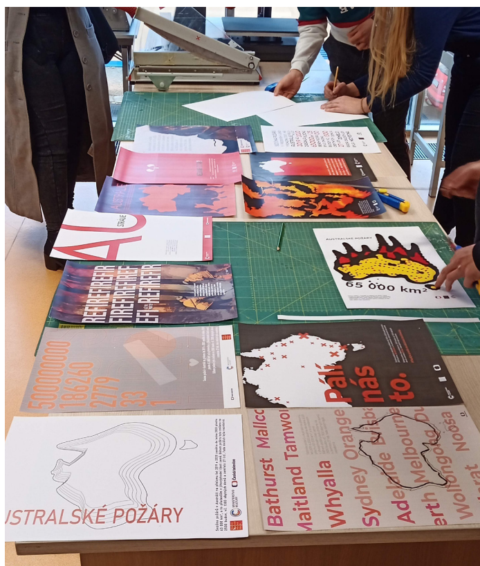
Plakáty jsou hotové, porota to nebude mít lehké.